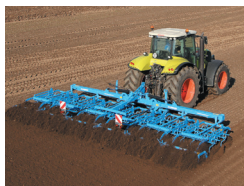
播種床コンビネーション