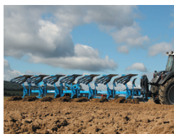
ハイブリッドプラウ