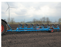
セミマウント式プラウ