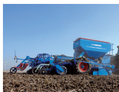
ドリルコンビネーション