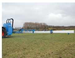
直装式スプレーヤー