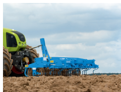
コンパクトコンビネーション