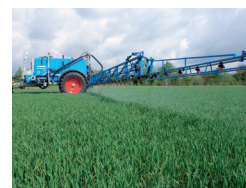
けん引式スプレーヤー

LEMKEN GmbH & Co. KG Weseler Straße 5 D-46519 Alpen Tel +49 2802 81 0 Fax +49 2802 81 220 lemken@lemken.com www.lemken.com