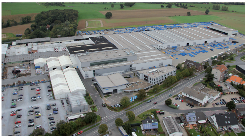
アルペンのレムケン本社・工場

高性能畑作機械のスペシャリストとしてレムケン 世界中に社員1,000名、売上高3.5億ユーロ以上 の実績を築き、欧州では先端企業の一社です。 1780年に、もともと小さな鍛冶屋として設立されて 以来、当ファミリー企業は、高性能のカルチベーシ ョン作業機、シードドリル、スプレーヤーなどの高性 能農業作業機をドイツ・アルペン地方にある本社と その他2拠点で生産しています。年産約15,000 台の生産台数のうち65%は輸出されています。