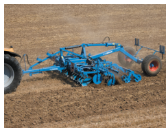
コンパクトディスクハロー